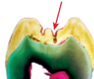
Kariesbefallene Fissur im Querschnitt

... für unsere Zähne. Besonders anfällig dafür sind Zähne mit „zerklüfteter“ Oberfläche, in erster Linie also die Backen- und Mahlzähne. Ihre Fissuren – so werden die Furchen und Rillen genannt – sind oft sehr eng, verwinkelt und tief: ein idealer Schlupfwinkel für Bakterien, zu dem eine Zahnbürste selbst bei sorgfältiger Handhabung nicht vordringen kann. In diesen Nischen setzen sich Speisereste fest. Es bildet sich Zahnbelag. Die in den Fissuren versteckten Bakterien und Zuckermoleküle gehen eine unheilvolle Verbindung ein: Bakterien erzeugen aus Zucker Säure, die den harten Zahnschmelz auflöst. So entsteht besonders bei Kindern und Jugendlichen die sehr häufige Kauflächenkaries.